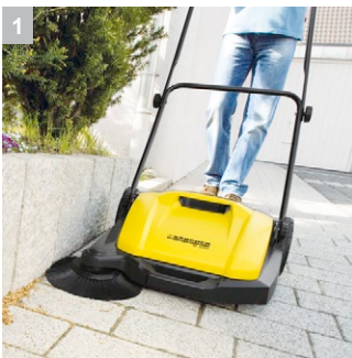
1 Односторонняя щетка