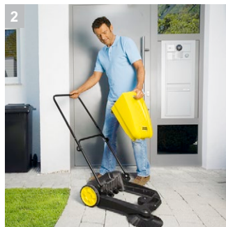
2 Подходящий контейнер для мусора