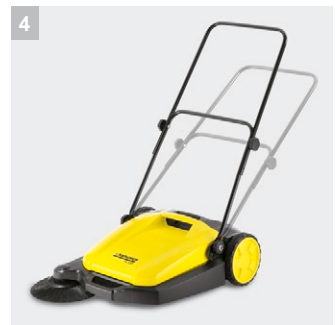
4 Регулируемая рукоятка